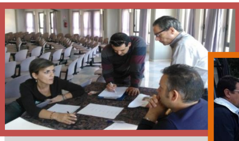
Formazione degli animatori della legalità