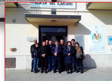
Visite a beni confiscati e assegnati per riutilizzo sociale